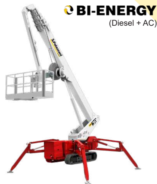
BI-ENERGY (Diesel + AC)