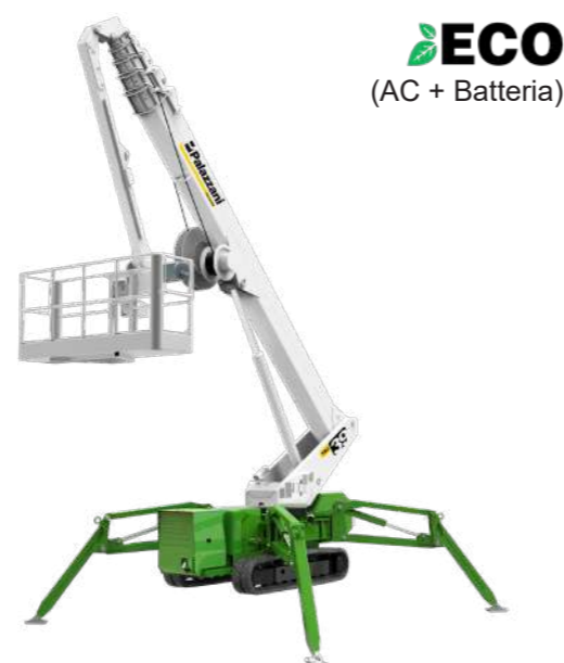
ECO (AC + Batteria)