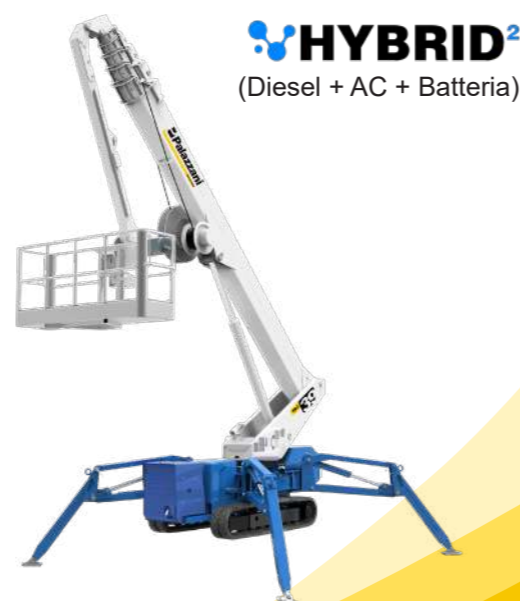
HYBRID 2 (Diesel + AC + Batteria)