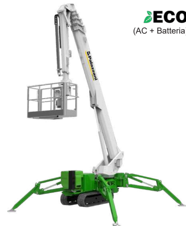
ECO (AC + Batteria)