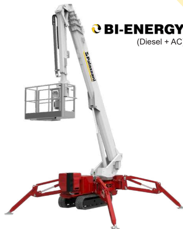
BI-ENERGY (Diesel + AC)